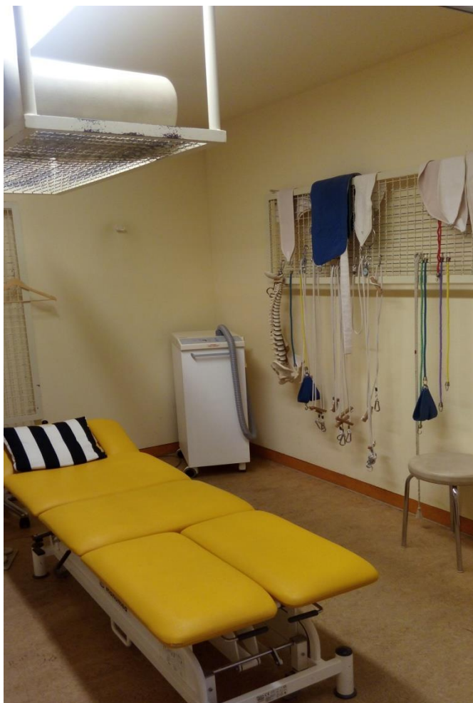
Moje stanowisko pracy.