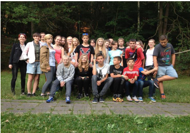
Uczestnicy zeszłorocznego polsko-niemieckiego letniego laboratorium

Poza siedzeniem w biurze, od czasu do czasu mamy też wyjazdy np. na noc muzeów, gdzie dzieci mogą razem z nami zanurzyć się w świecie nauki. W kwietniu byliśmy w muzeum starych aut w Zwickau. Było to naprawdę świetne miejsce. Czasami całą grupą współpracowników wychodziliśmy do restauracji, czy na imprezę.