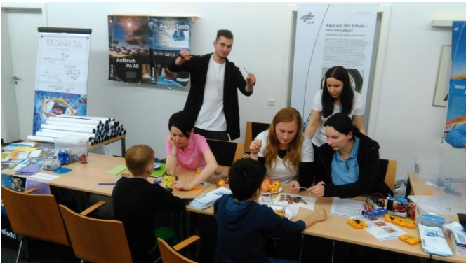
Nasze stanowisko na Nocy Muzeów w Zwickau

Poza siedzeniem w biurze, od czasu do czasu mamy też wyjazdy np. na noc muzeów, gdzie dzieci mogą razem z nami zanurzyć się w świecie nauki. W kwietniu byliśmy w muzeum starych aut w Zwickau. Było to naprawdę świetne miejsce. Czasami całą grupą współpracowników wychodziliśmy do restauracji, czy na imprezę.