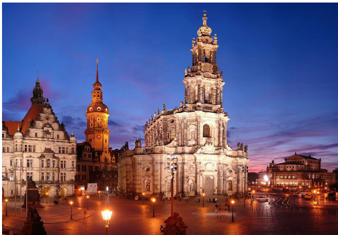
Katedra Świętej Trójcy