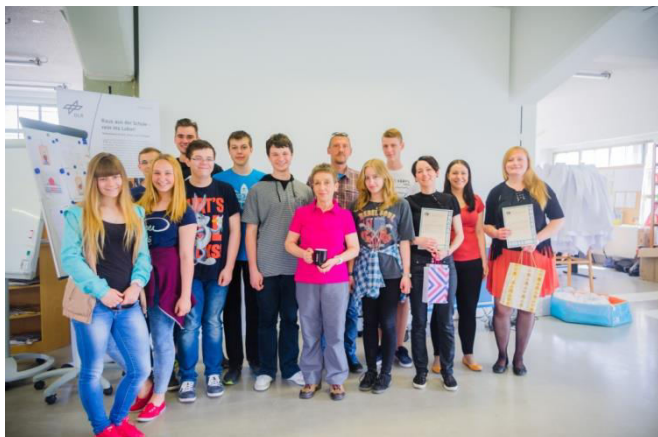
Polska grupa uczniów z Porajowa.

Moimi zadaniami podczas odbywania praktyki było pomaganie uczniom podczas eksperymentów, zajmowanie się pracami administracyjnymi, promocja DLR_School_Lab TU Dresden w polskich gimnazjach i liceach oraz przygotowanie projektu polsko-niemieckiego letniego laboratorium, które w sierpniu tego roku odbędzie się na Karkonoskiej Państwowej Szkole Wyższej w Jeleniej Górze.