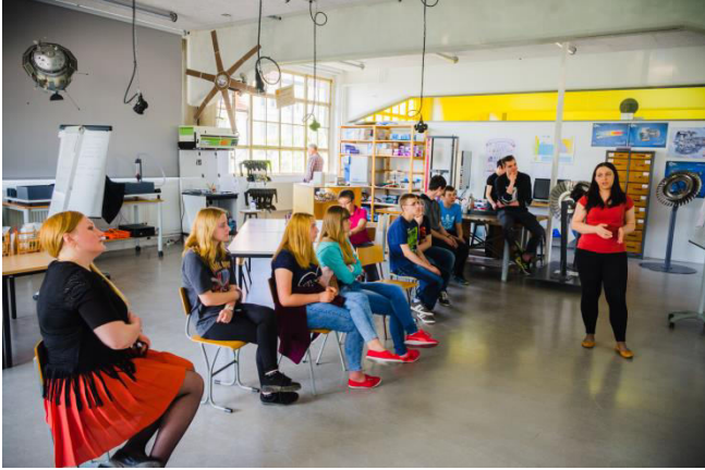
Prezentacja na temat letniego polsko-niemieckiego laboratorium